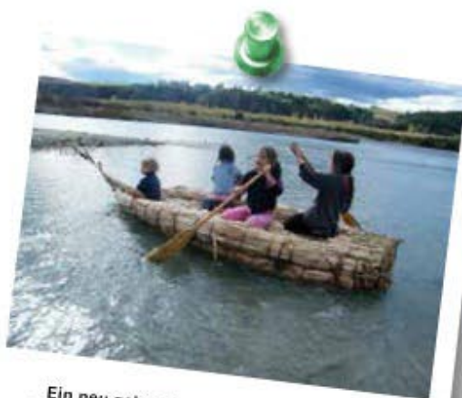
Ein neu gebautes mokihi . Diese aus Schilf ( raupo ) gefertigten Boote sind uralte Waitaha-Tradition. Nur zwei oder drei Menschen aus der Familie Te Maihara beherrschen heute noch diese Handwerkskunst.

Der Kummer der heute lebenden Waitaha betrifft aber weniger ihre geringe Zahl, sondern vielmehr ihre Ablehnung, ja geradezu die Leugnung ihrer Existenz. Nach offizieller Lesart der sehr einflussreichen Ngai Tahu , dem alles dominierenden Maori-Stamm der Südinsel, sind die Waitaha seit fast zwei Jahrhunderten ausgestorben, das heißt durch die damals auf die Südinsel eingedrungenen Ngai Tahu „assimiliert“ und vollständig ausgesogen worden. Heute lebende Nachfahren, soweit sie sich noch immer als Waitaha bezeichnen, wären daher in Wahrheit längst Angehörige der Ngai Tahu . Das ist in etwa so, als dürfte es seit der Gründung des Deutschen Reiches keine Bayern oder Sachsen oder Ostfriesen mehr geben, weil sie nun alle Deutsche sind.