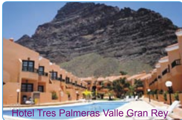
Hotel Tres Palmeras Valle Gran Rey

führt er mit dem Schwerpunkt Selbsterkenntnis und persönliche Weiterentwicklung durch.