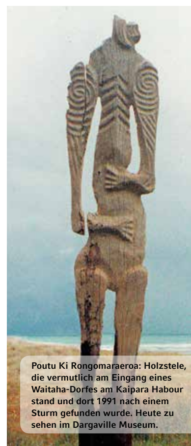
Poutu Ki Rongomaraeroa: Holzstele, die vermutlich am Eingang eines Waitaha-Dorfes am Kaipara Harbour stand und dort 1991 nach einem Sturm gefunden wurde. Heute zu sehen im Dargaville Museum.

Waitaha heißt „Wasserträger“, der Name wird damit verbunden, dass jeder gesunde Mensch an jedem Morgen bei Sonnenaufgang zum Fluss ging und zwei Flaschenkürbisse mit Wasser füllte. „ Einer kam ins Haus, der andere ging in den Garten “ – ein treffendes Bild für die ökologische Grundhaltung der Waitaha, bei der Mensch und Natur die gleiche Fürsorge erfuhren. An anderer Stelle heißt es: „ Jeder von uns ist ein Garten. Die Erde und der Mutterleib sind das Gleiche. “